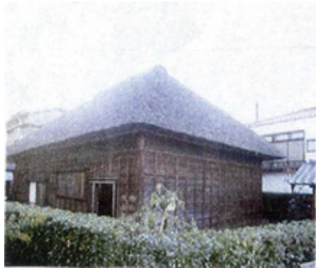
旧大塚家住宅(県指定文化財)

「郷土資料館」には移築して「青かべ物語」の町を再現。三軒長屋は県指定文化財、魚屋、タバコ屋、漁師の家は市の文化財