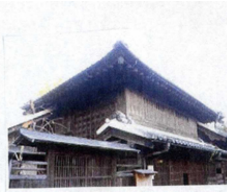
旧宇田川家住宅(市指定文化財)